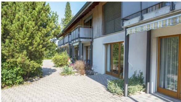
Alle Zimmer haben einen Sitzplatz oder Balkon

Die kurzen Kontakte, die auf diesen Spaziergängen, bei kleinen Besorgungen in den Dorfläden oder bei einem Kaffee im Restaurant entstehen, schätzen unsere Bewohner sehr. Sie geben ihnen das Gefühl, weiterhin am Leben teilzuhaben.