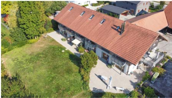
Mitten im Dorf mit einem grossen Garten

Soweit es die Situation und die Gesundheit unserer Bewohner und Bewohnerinnen erlaubt, erkunden wir mit ihnen auf einem Spaziergang die ländliche, zum Teil vertraute Umgebung des Dorfs und beobachten die Schönheiten der Natur.